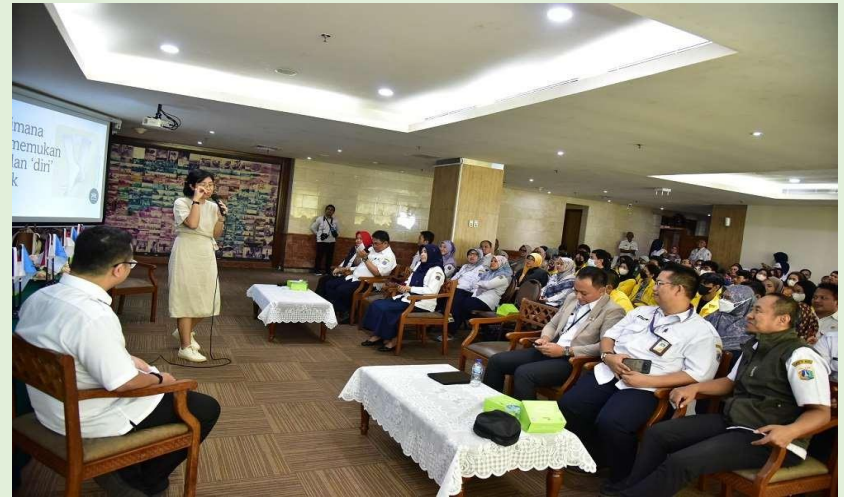
Aula Blok G Balaikota, 24 Mei 2023: Seminar bersama AFUTAMI, selaku penasehat AAI DKI Jakarta