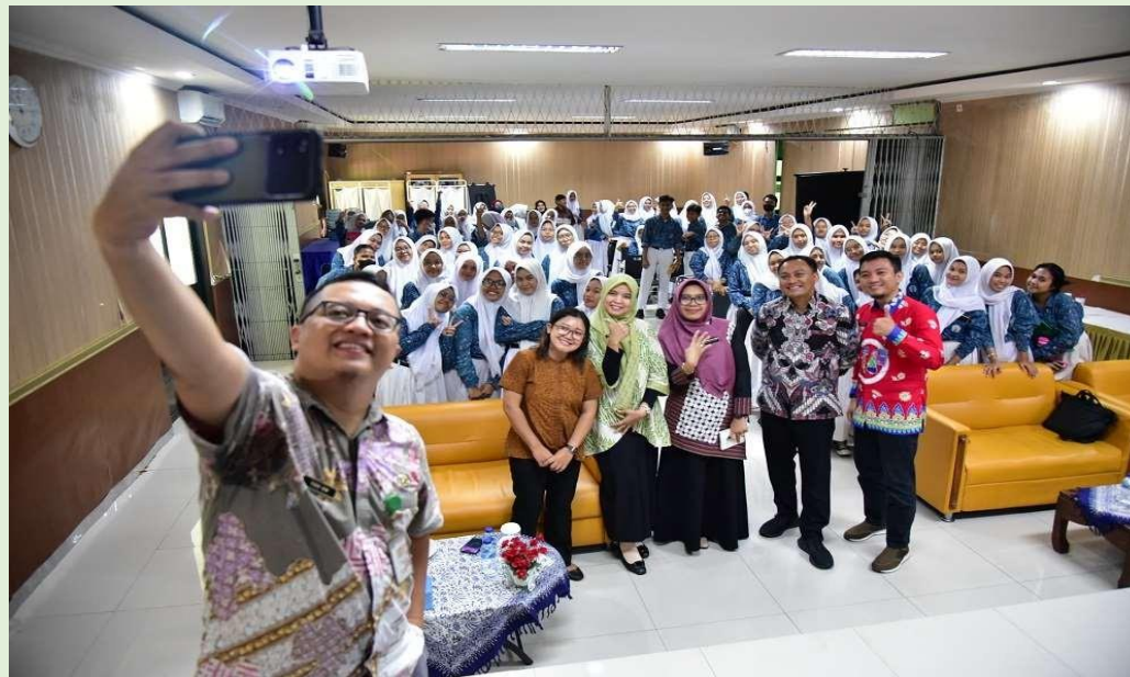
SMK Negeri 44 Jakarta, 22 Juli 2023: Pengenalan Arsip di Kalangan Pelajar