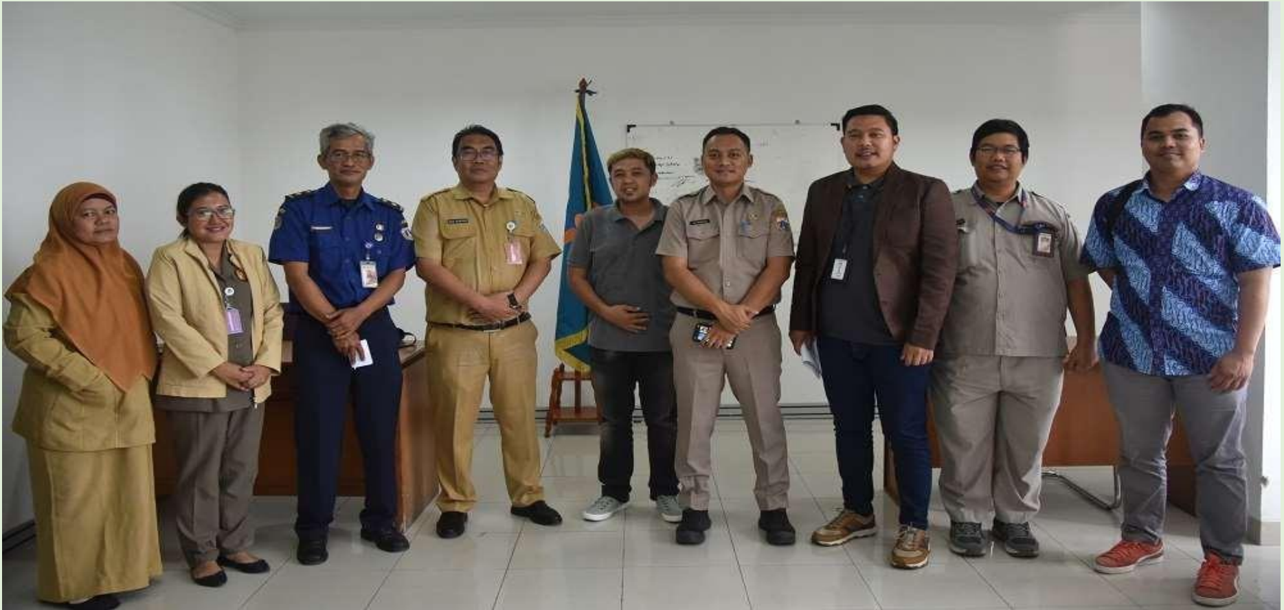
Ruang Sekretariat AAI DKI Jakarta, 31 November 2023: Kunjungan Bank DKI dalam rangka Penataan Ruang Sekretariat AAI DKI Jakarta