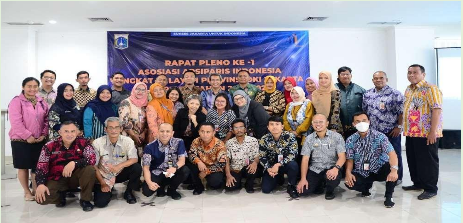
Aula Dinas Perpustakaan dan Kearsipan Provinsi DKI Jakarta, 25 Juli 2023: Rapat Pleno ke-1