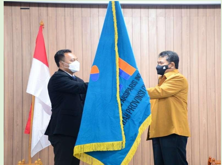
Aula Dinas Perpustakaan dan Kearsipan Provinsi DKI Jakarta, 1 Desember 2022: Pelantikan Ketua dan Pengurus Asosiasi Arsiparis Indonesia Wilayah Provinsi DKI Jakarta periode 2023-2025