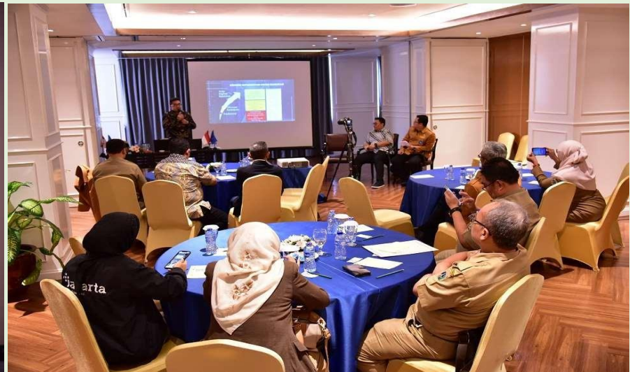
Hotel Borobudur Jakarta, 31 Oktober 2023: AAI Executive Class: Digital Ecosystem for Archives Management